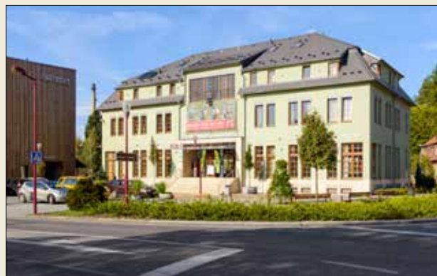
Dům Českého Švýcarska v Krásné Lípě

tel. (+420) 724 863 604, e-mail: info@arz.cz www.arz.cz